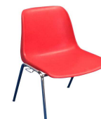
Sedia con scocca agganciabile rossa - ignifuga