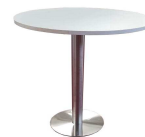
Tavolo con base in acciaio inox satinato