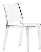
Sedia CRYSTALL trasparente