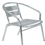
Poltroncina alluminio KELLY