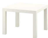
Tavolino basso 40x40 h. 40 cm - bianco