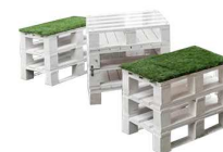
Tavolino e sedute in pallets