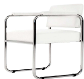
Poltrona in pelle bianca con braccioli EMMA