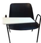
Sedia nera con tavoletta